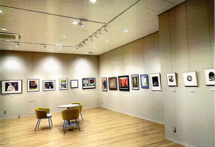
前回交流会 会場風景