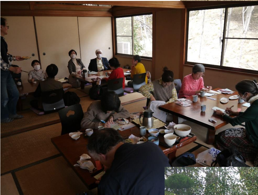
山菜料理すくね茶屋